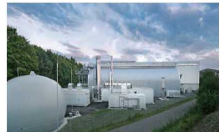
スウェーデンでの廃棄物処理事業（19年3月契約調印）