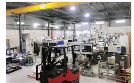
フィリピン・部品製造・販売事業 (18年9月契約調印)