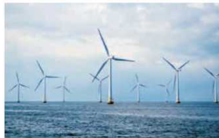
英国での洋上風力発電（18年11月契約調印）