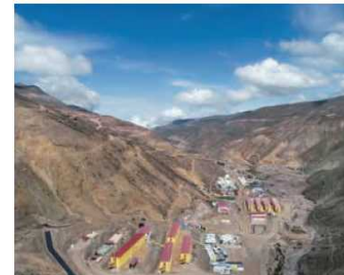
ペルー・銅鉱山開発事業 (19年3月契約調印)